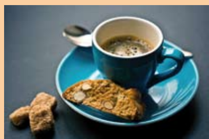
Gemütlich sitzen und plaudern beim offenen Café.

Der Clubplan hängt am Büro, Leutewitzer Ring 31, aus und ist im Internet unter www.lebenshilfe-dresden.de/de/ferien-freizeit/freizeitangebote/ zu finden.