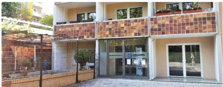
Das Büro der Lebenshilfe Dresden e.V. in Gorbitz, Leutewitzer Ring 31

Spiele- und Kreativnachmittage und ein offenes Café. Bei allen Veranstaltungen gibt es die Möglichkeit, miteinander zu reden, sich über Themen des Lebens auszutauschen und eine schöne Zeit gemeinsam zu verbringen. Die Veranstaltungen sind für alle Menschen – gleich ob mit oder ohne Behinderung – gedacht.