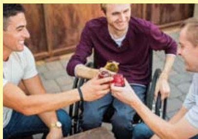
Nur für Männer! Der Männertreff findet an jedem ersten Montag des Monats ab 16.30 Uhr im Leutewitzer Ring 31 statt.

So gibt es regelmäßig Disko im InterWall, einen Männertreff,