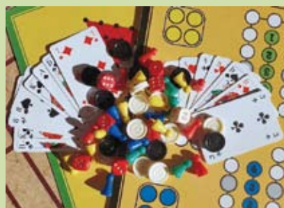
Am Spielenachmittag werden bekannte Brett- und Kartenspiele ausgepackt.

Einmal im Monat erscheint der Clubplan, auf dem die Veranstaltungen veröffentlicht werden.